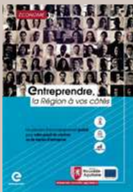
Entreprendre, la Région à vos côtés